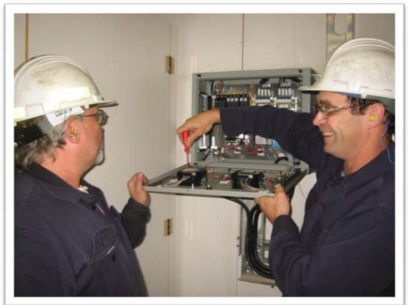
Installation de nouveaux compteurs électriques.

Voici une saisie d'écran montrant la consommation d'électricité de l'une des chaînes de finition de l'usine. Le logiciel affiche la consommation quotidienne d'électricité, le pourcentage de l'objectif atteint, la quantité d'énergie consommée et son coût, ainsi que les économies cumulatives.