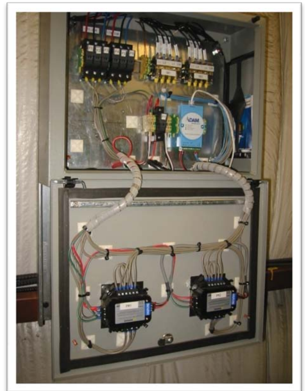
Mesure de la consommation d'électricité à l'usine de St. Stephen de Flakeboard.

Même si le SIGE de Flakeboard n'est pas encore pleinement opérationnel, Burke explique que des cibles seront établies pour chacun des 12 CCE et que les gestionnaires de chacun des CCE auront le mandat d'atteindre ou de dépasser ces cibles. Les centres de comptabilisation de l'énergie englobent les procédés de production utilisateurs d'énergie (électricité, mazout, eau, air comprimé) pour chacune des chaînes de production et de finition où se concentre l'utilisation de l'énergie.